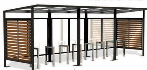
Wiaty ściany drewno i poliwęglan lity