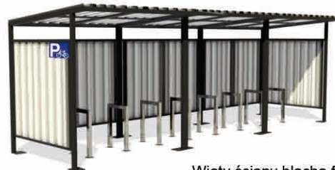
Wiaty ściany blacha falista