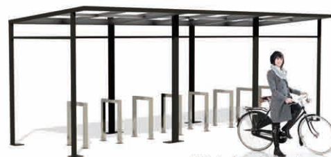
Wiaty bez ścian bocznych